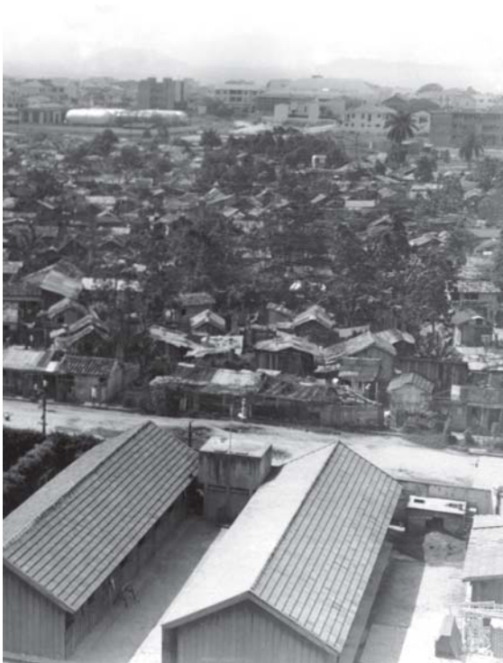
Favela da Praia do Pinto/ Cidade Maravilhosa. Construção do Parque Proletário Provisório nº 3 – Praia do Pinto – RJ - Código - VT/ MS/19390207