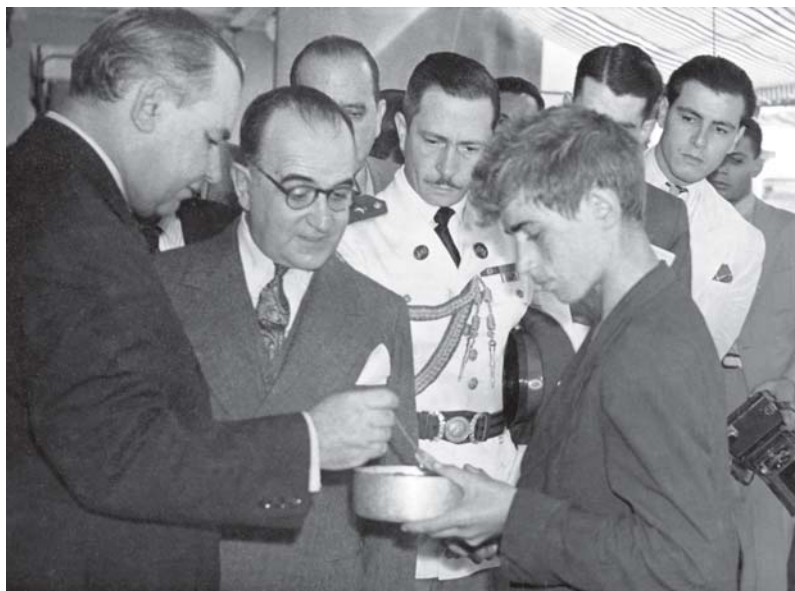
Visita do Presidente Getúlio Vargas ao Albergue da Boa Vontade – RJ [20/06/1941] - Código - VT/ MS/19400226