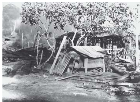
[Desmonte da Favela Largo da Memória – RJ] - Código - VT/MS/19390207