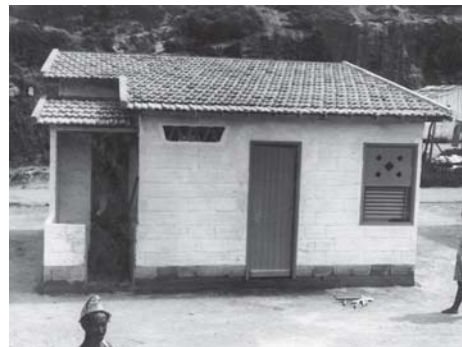
Casas experimentais no Parque Proletário Provisório nº 1 – Gávea – RJ - Código - VT/ MS/19390207