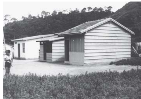
Casas experimentais no Parque Proletário Provisório nº 1 – Gávea – RJ - Código - VT/ MS/19390207