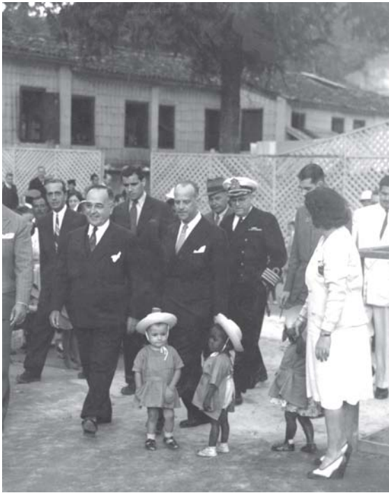
Visita do Presidente Getúlio Vargas ao Parque Proletário Provisório nº 1 – Gávea – RJ – 1944 - Código - VT/ MS/19390207