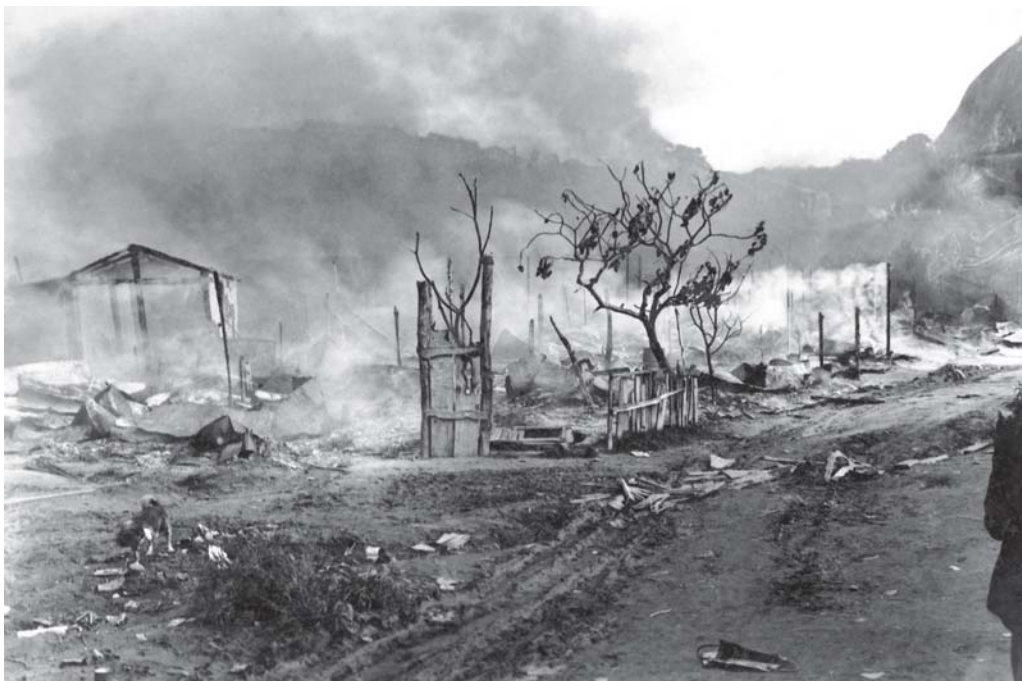
Desmonte da Favela Largo da Memória – RJ – Código - VT/MS/ 19390207