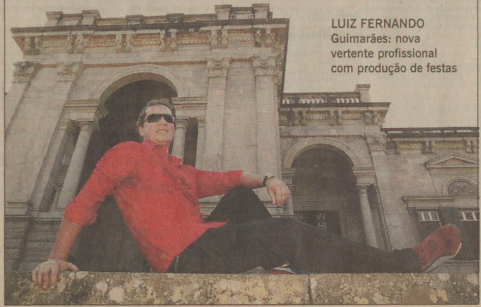
LUIZ FERNANDO Guimarães: nova vertente profissional com produção de festas

• Luiz Fernando Guimarães sempre adorou produzir as próprias festas. Agora resolveu expandir os negócios aproveitando o talento que só os amigos conheciam. O ator está preparando o primeiro festival de música eletrônica da Costa Verde, o "Night connections", em Itaguaí, dia 20 de setembro. "É bom iniciar uma nova vida profissional", conta.