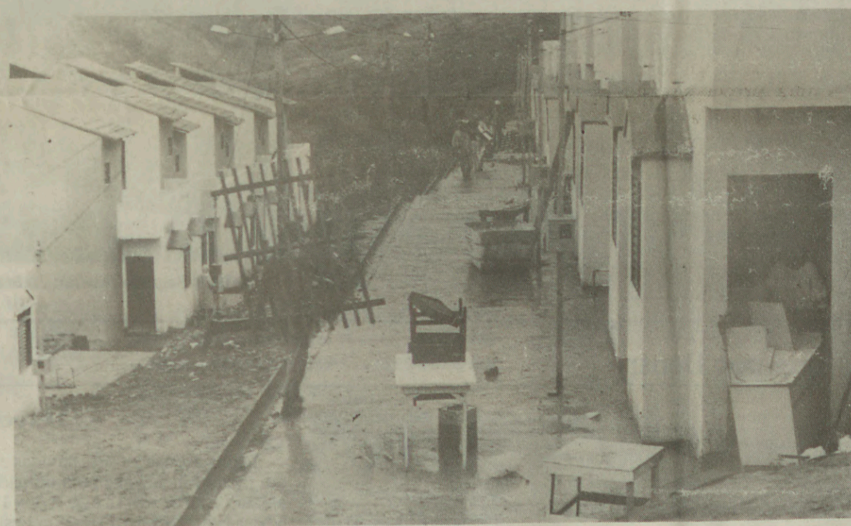
... onde receberam casas seguras e confortáveis no Conjunto Esperança, através de sorteio feito pela Prefeitura