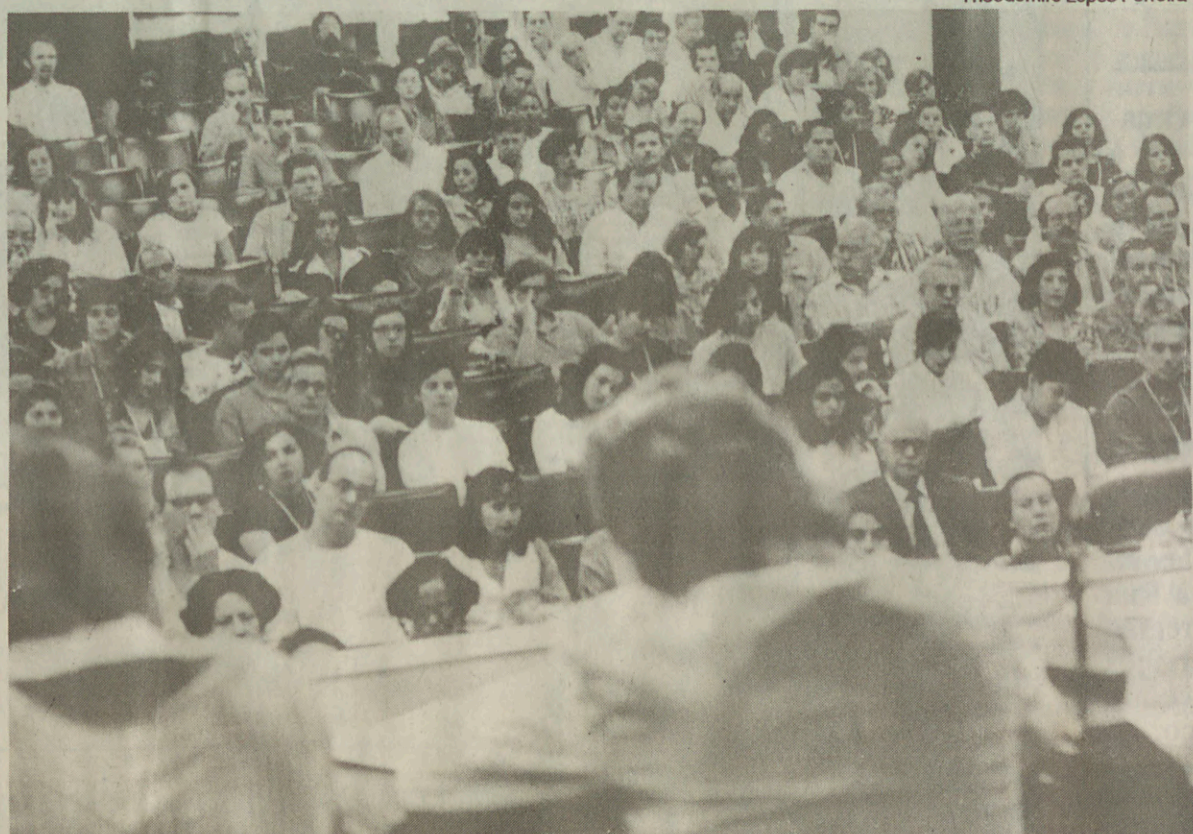
Debate sobre Plano Diretor e Lei do Solo: discussão para aprimorar proposta da Prefeitura