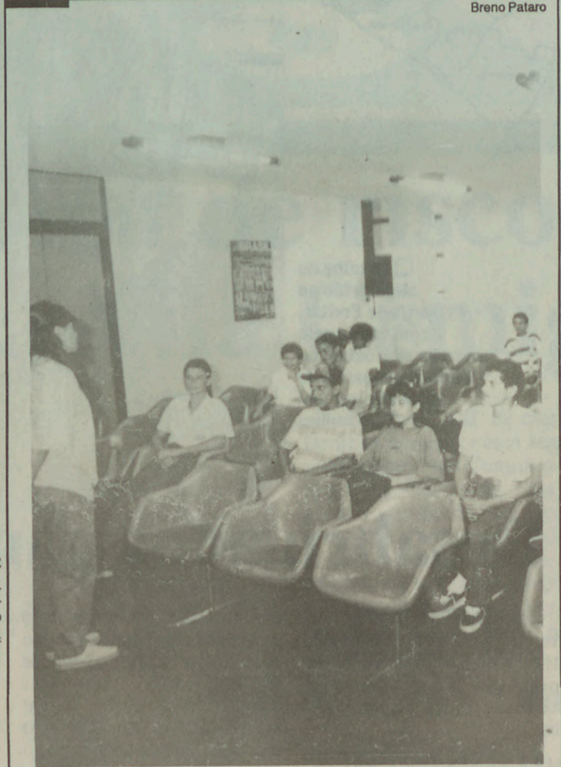
Aprendendo a trabalhar: adolescentes fazem curso de office-boy

Serão comercializados hortifrutigranjeiros, carnes (incluindo peixes e congelados), ovos, biscoitos e café. Haverá ainda vendas em estilo mercearia, produtos naturais, artesanais e floricultura. Hoje há cerca de 60 feirantes ativos na cidade. A ideia da Prefeitura é desenvolver um trabalho conjunto, que amplie e torne de melhor qualidade a oferta de alimentos à população.