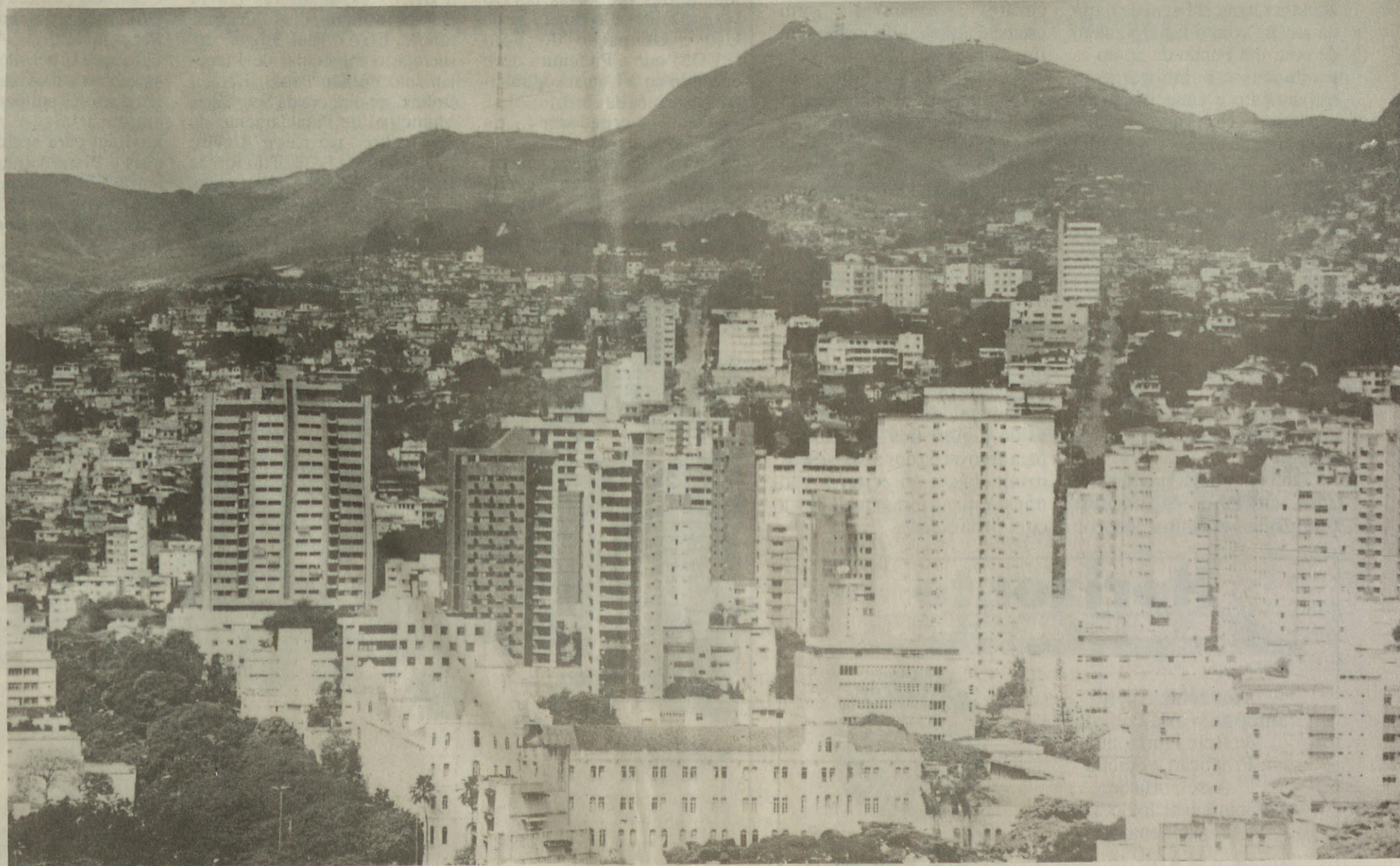
Vista da Serra do Curral a partir do Centro de Belo Horizonte: área passa a ser símbolo oficial da cidade com o voto popular