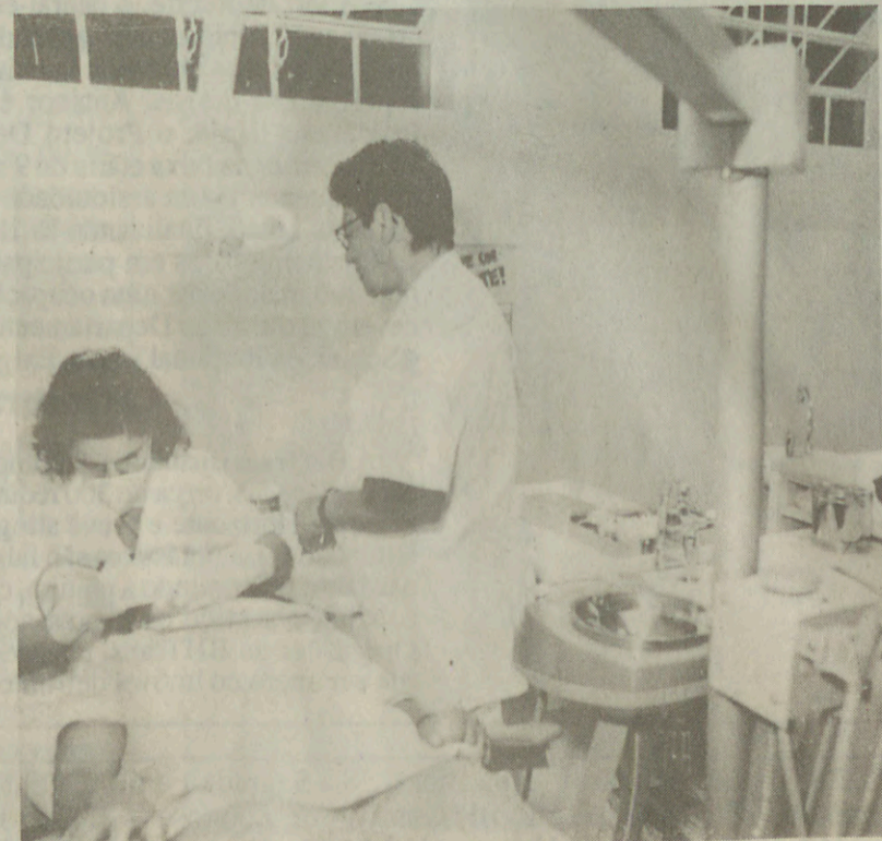
Odontologia: 120 novos consultórios e descentralização

Quando se toma como referência o público de 6 a 19 anos, este índice cai para 45%. A grande demanda está concentrada na faixa de 20 aos 40 anos, com 90% necessitando de intervenções curativas.