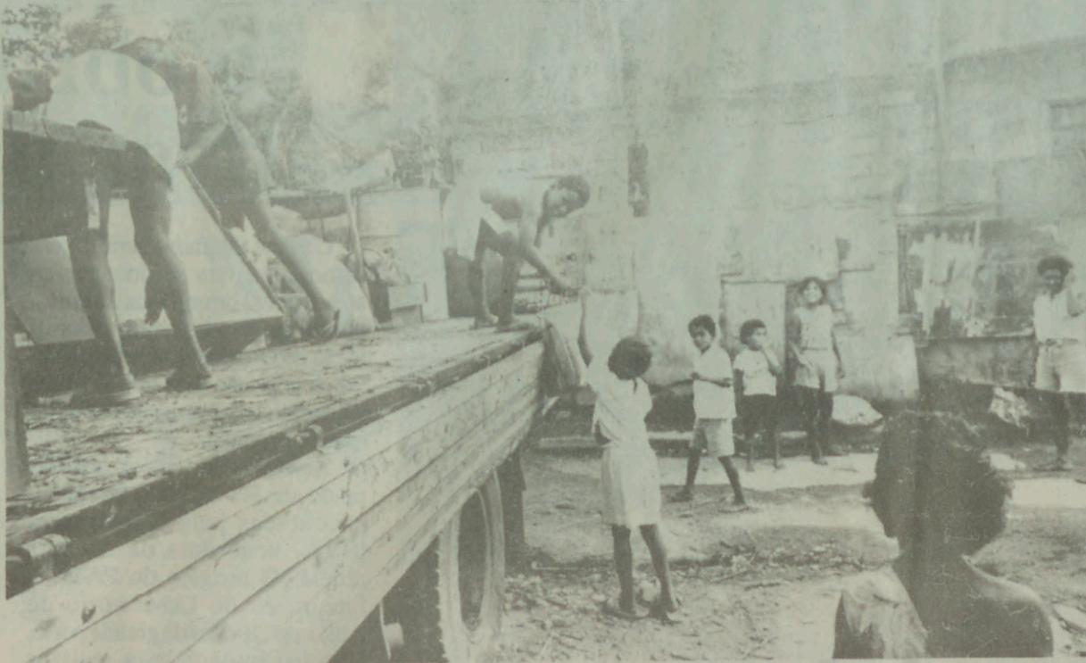
Moradores são removidos do "Lixão", em novembro de 1993, numa ação preventiva nas áreas de risco...

Em cada um dos módulos foi instalado também um guarda-móveis, uma creche, um banheiro coletivo e lavanderia. Eles foram construídos em madeirite, com telhado de amianto. O investimento é de R$ 526 mil. Ele terá toda a infra-estrutura necessária, como água, esgoto e energia elétrica. Ganhará ainda um campo de futebol e um pomar, em sua área de 4,4 mil metros quadrados. É um dos muitos símbolos de que Belo Horizonte realmente inverteu suas prioridades.