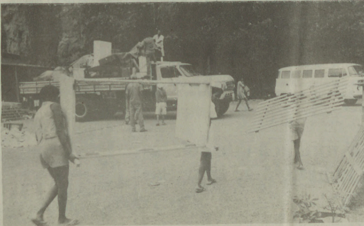
... em março de 1995, são transferidos do abrigo da Pompéia para a Vila Cemig, no Barreiro de Cima...