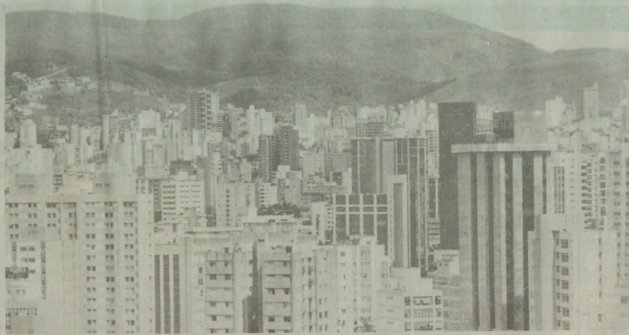
A Serra do Curral, vista da região central: 271.371 votos no "Eleja BH", que envolveu toda a cidade

Foi este engajamento popular que motivou uma "corrida" emocionante, já ao final da campanha, entre a Serra do Curral e a Igrejinha da Pampulha. Cada um dos 943.126 votos, entretanto, garantiu a representatividade e a importância deste "Eleja BH", uma cidade agora com um símbolo consagrado pelo povo.