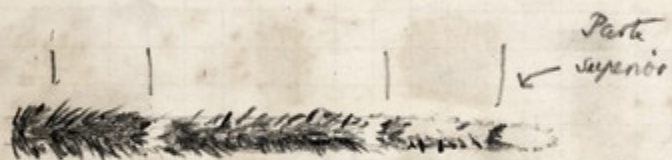
desenho sem camara clara Palpo de CM 36

camara clara - Oc. 5x Obj. 10x. M.P.B. - 9.12.40